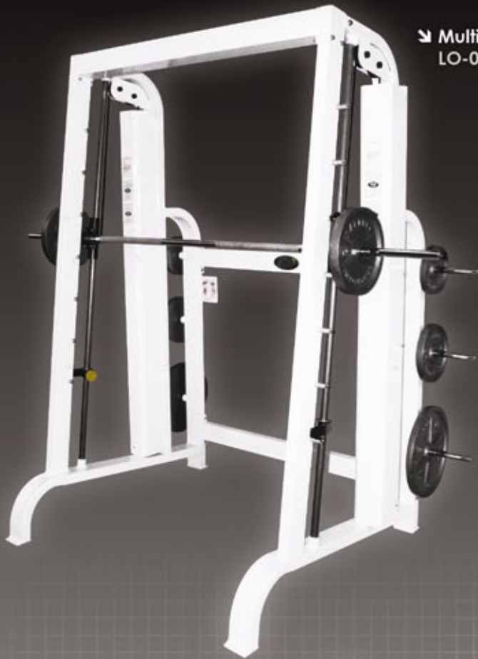
↘ Multifuerza LO-046