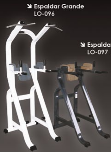
↘ Espaldar Grande LO-096