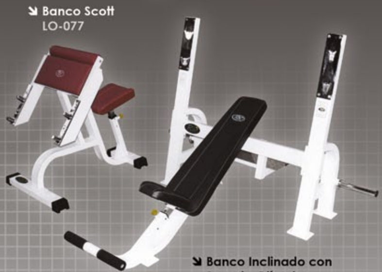
↘ Banco Scott LO-077